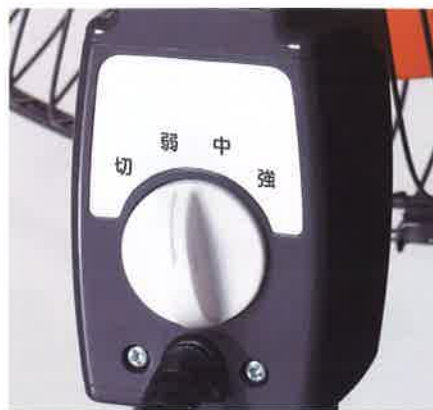
ロータリー式の操作スイッチ